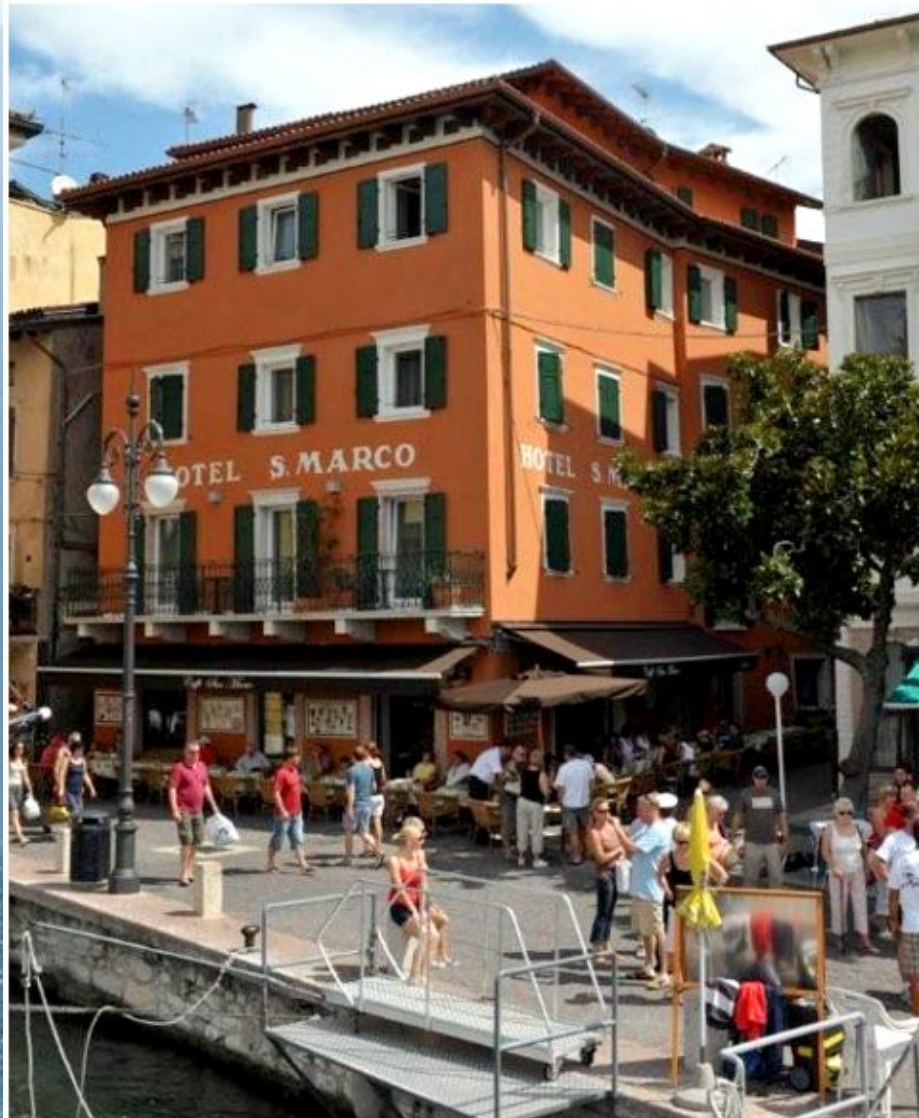
Hotel - San Marco Malcesine